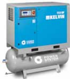
▲ KELVIN 11-10-270 DF