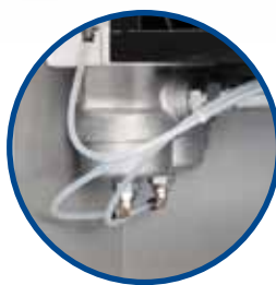
DOPPIA FILTRAZIONE DELL'ARIA COMPRESSA