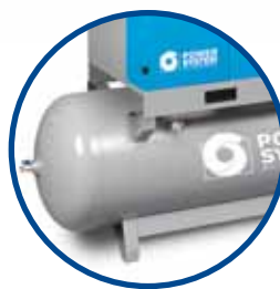
FACILE DA TRASPORTARE