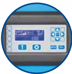
CONTROLLO INTUITIVO DI ULTIMA GENERAZIONE