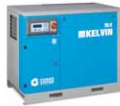
▲ KELVIN 15-10