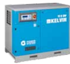
▲ KELVIN 11-10 DV