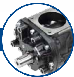
GRUPPO VITE DI ALTA QUALITÀ

Tutto ciò di cui hai bisogno per un'aria compressa secca, pulita... ...super silenziosa e super affidabile!