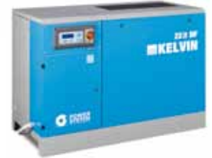
▲ KELVIN 22-10 DF

La gamma KELVIN è disponibile in diverse versioni per soddisfare qualsiasi esigenza di installazione: