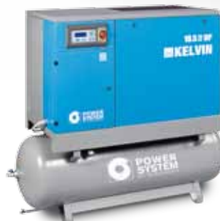
▲ KELVIN 18,5-10-500 DF