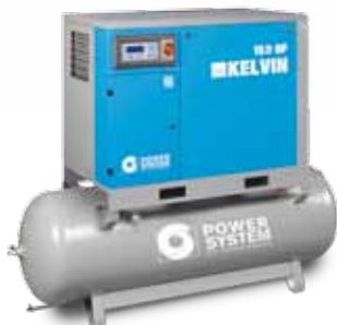
▲ KELVIN 15-10-500 DF